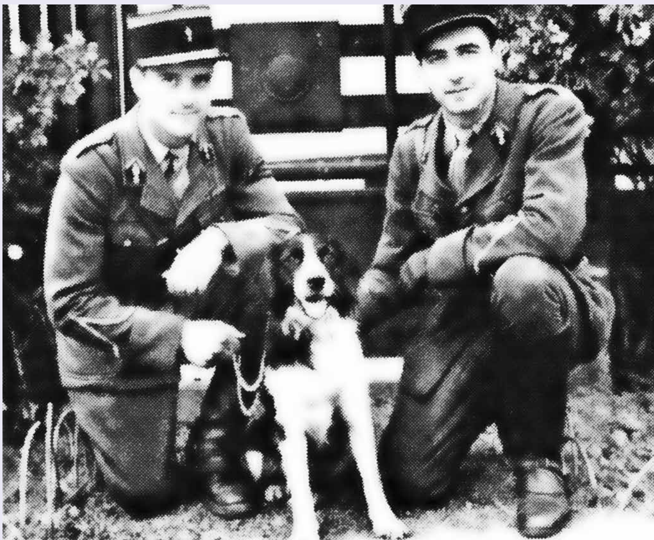
Le chien Targis de l'escadron de Garde républicaine de Thionville

Des années 1970 au début des années 2000, la gendarmerie maritime a entretenu une véritable tradition de mascottes embarquées sur ses patrouilleurs, comme le boxer Hans sur le P 784 Géranium , le berger allemand Zeff sur le P 787 Jonquille ou l'épagneule Nordik sur le P 740 Fulmar . Ces chiens ont vécu une véritable vie de... Pacha !