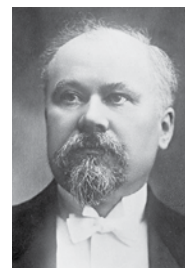
Raymond Poincaré, président de la République française du 18 février 1913 au 18 février 1920, soutient le vote de la loi des trois ans.