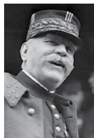
Joseph Joffre, nommé généralissime de l'armée française en 1911, propose le vote d'une loi des trois ans.

l'effondrement de 1940 par ses effets directs – crise des effectifs militaires et manque d'ouvriers – et plus encore indirects – asthénie économique, état d'esprit frileux, politique extérieure et stratégie timorées.