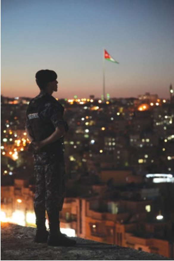
le gendarme jordanien veille sur la ville...

ou des cultures arabes ou anglo-saxonnes au travers d'échanges avec des librairies.