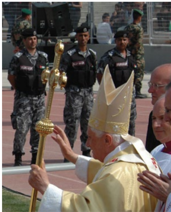
Gendarmes jordaniens en service d'ordre lors de la visite du pape en Jordanie, en mai 2009

• La gendarmerie édite différentes publications, notamment le « magazine de la Gendarmerie », quatre fois par an, qui traite des sujets variés comme la sécurité nationale