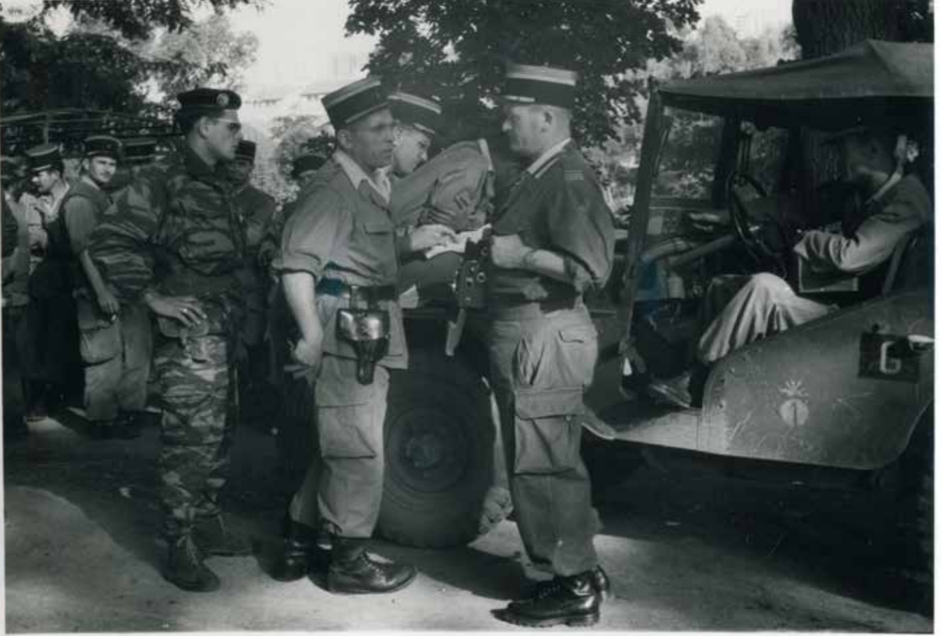
Des gendarmes en opération accompagnés de militaires

de gendarmerie et trois anciens procureurs militaires ou substituts ont également accepté de témoigner.