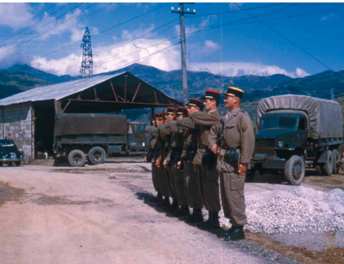
Fonds escadron 51/7 de gendarmerie mobile de Dole